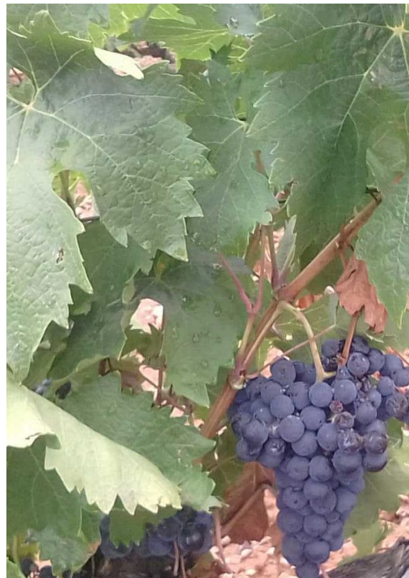
Izqda. Cepa vendimiada (N2. Vendimia. La parcela está vendimiada); drcha. Tempranillo en N1. CARIÑENA MEDIA. 03/09/2024.