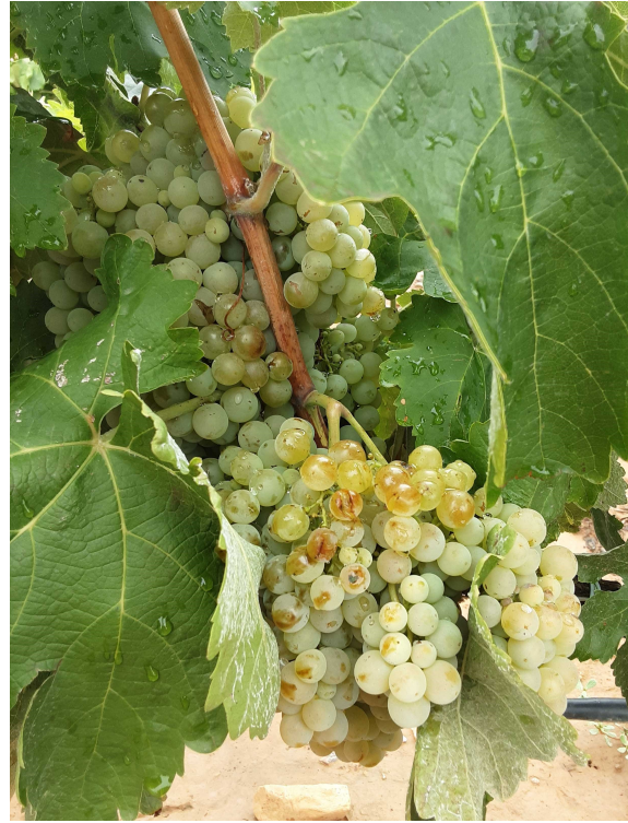
Racimos en N1. Maduración. Izqda. Tempranillo; drcha. Macabeo en CARIÑENA MEDIA. 03/09/2024.