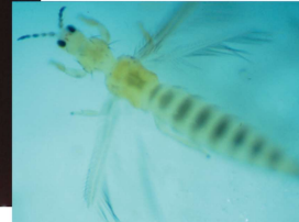
Foto 5. F. occidentalis