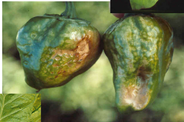
Fotos 6-7. Síntomas en pimiento