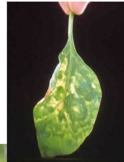
Fotos 1-4. Daños en tomate