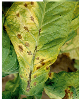
Fotos 8-9. lesiones en lechuga y tabaco