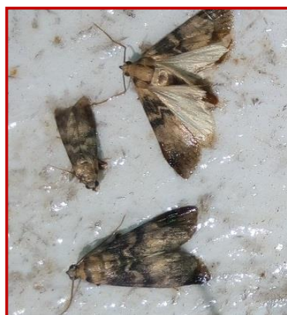
Adulto de Euzophera en trampa

Los daños de esta plaga en plantaciones adultas son de poca importancia, sin embargo, es en plantaciones jóvenes donde este lepidóptero es más dañino pues hace galerías en el tronco, provocando retraso en el crecimiento, e incluso en el caso de rodear el tronco puede llegar a matar al árbol.