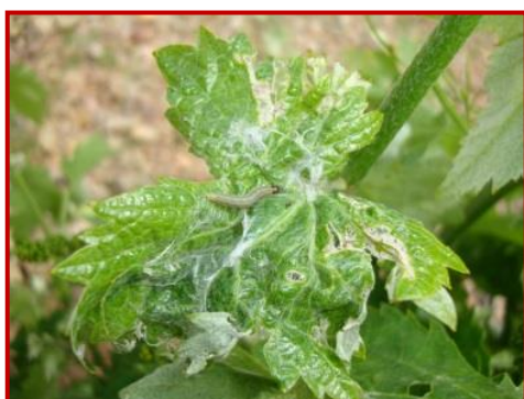
Larva de piral

Durante los últimos días del mes de abril y primeros de mayo se han detectado las primeras larvas de este lepidóptero, principalmente en la zona de Cariñena, en parcelas que el año anterior tuvieron problemas.