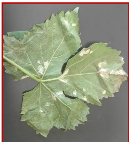
Daño de oídio en hoja

Se han detectado las primeras infecciones en las variedades más sensibles a este hongo durante el mes de mayo en las zonas de Cariñena y Borja. Se debe seguir protegiendo el viñedo realizando los tratamientos en los momentos indicados en el Boletín Nº 2: