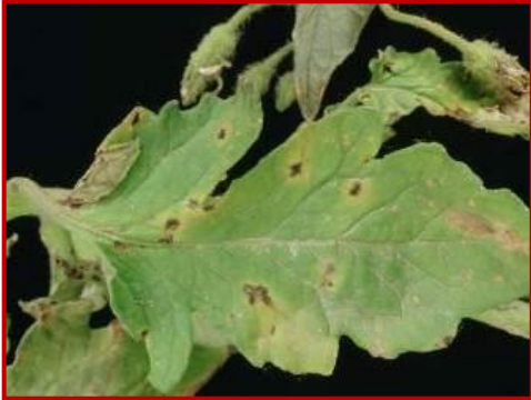
Pseudomonas en tomate

Las condiciones climáticas que se están produciendo en los últimos días (tormentas de primavera) incrementan el riesgo de aparición de bacteriosis producidas por pseudomonas. Los síntomas consisten en manchas necróticas, 1-3 mm de diámetro, rodeadas de un halo amarillo. Vigilar las plantaciones y, si fuese necesario, tratar con productos a base de cobre.