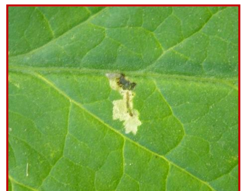
Daño de tuta

Hay que tener en cuenta que es una plaga muy influenciada por el calor, y que si las temperaturas suben en los próximos días se empezarán a ver explosiones de daños de la misma.