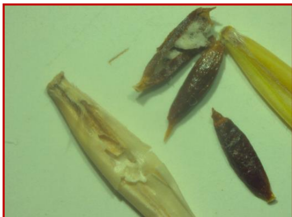
Bolsas o agallas

Gracias a los diferentes métodos de control que se han ido realizando en los últimos años, el número de parcelas infectadas por este nematodo han disminuido, a pesar de ello todavía existen la presencia del nematodo Anguina spp. en espigas vacías o espigas erectas de cebada en varias zonas de Aragón.