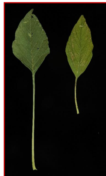
Hojas de A. palmeri (izda.) y de A. retroflexus (dcha.)

Esta mala hierba es responsable de pérdidas muy elevadas en maíz y en otros cultivos y dificulta la cosecha por su gran tamaño. Una sola planta es capaz de producir miles de semillas y se adapta a ambientes muy diversos, desarrollándose más en buenas condiciones y menos en las peores (secano, malos suelos) pero siempre siendo capaz de completar su ciclo, si no se actúa.