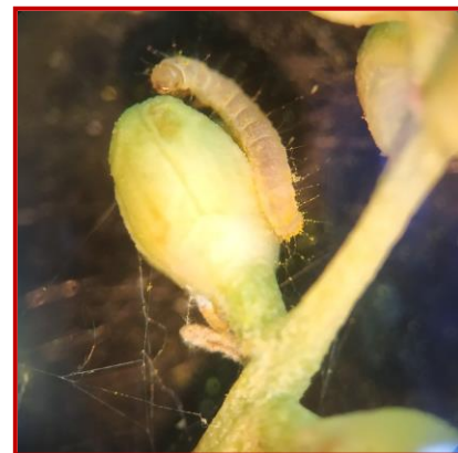
Larva de Prays en botón floral

El caolín recubre los frutos evitando la puesta, por tanto, el tratamiento se realizará cuando el fruto esté recién cuajado, antes de que la polilla realice la puesta.