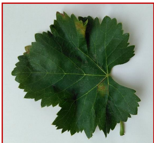
Mildiu en hoja

No se han observado daños de esta enfermedad hasta el momento, pero las precipitaciones acaecidas en la segunda quincena de mayo en algunas zonas de la Comunidad Autónoma, junto con las suaves temperaturas y el estado fenológico del cultivo pueden provocar la aparición de las primeras manchas (infecciones primarias) durante los próximos días, se recomienda vigilar el viñedo.