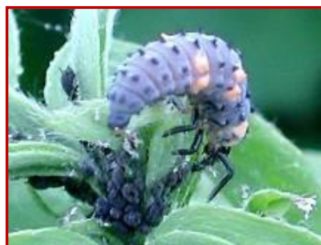
Larva de mariquita alimentándose de pulgones