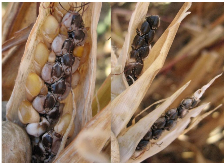
Aspecto de diferentes tipos de semillas de teosinte que se pueden encontrar en una parcela

Durante los meses de mayo y junio pueden emerger plántulas de esta mala hierba en las zonas afectadas en años anteriores, pero éstas son difíciles de diferenciar del cultivo de maíz . Si emergen plantas que tengan apariencia de maíz, pero estén fuera de la línea de siembra puede sospecharse que sea teosinte. Para confirmarlo, no obstante, habrá que arrancar con cuidado la plántula para intentar sacar la semilla y ver si es de maíz o de coloración oscura correspondiente a teosinte.