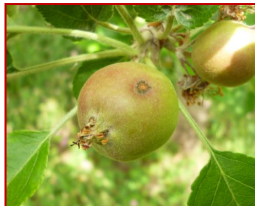
Daños de moteado en manzana

Las lluvias producidas en el pasado mes, aunque mínimamente, han provocado que en algunas parcelas se hayan detectado daños por moteado. En estas parcelas, si las condiciones son favorables debido a la lluvia o al intenso rocío, pueden desarrollarse contaminaciones secundarias que se traducirán unos días después en nuevos daños en hojas y frutos. Es por ello imprescindible en caso de riesgo, no descuidar las aplicaciones con los fungicidas indicados en el Boletín Nº 2.