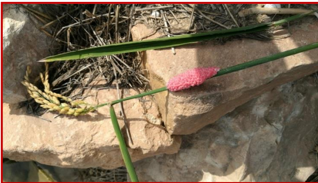
Huevos de caracol manzana

Es una especie herbívora muy voraz que se alimenta de numerosas especies de plantas acuáticas de fácil digestión. Realiza las puestas fuera del agua, en masas compactas sobre superficies duras o vegetación acuática. Los huevos son de color rosa-rojizo brillante y con el tiempo, adquieren un tono blanquecino.