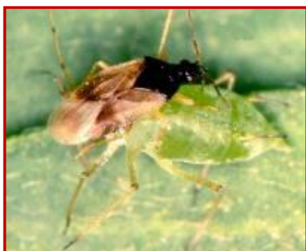
Antocórido alimentándose de pulgón verde

La eliminación de los auxiliares que provocan los tratamientos fitosanitarios puede provocar un recrudecimiento de las plagas de pulgón, de ahí la importancia de evitar tratamientos químicos innecesarios.