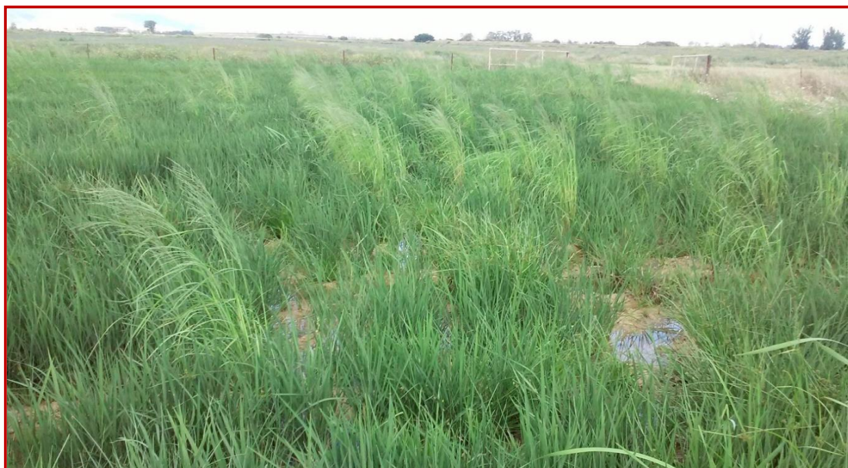
Aspecto de una parcela de arroz con infestación de Leptochloa spp. Se observan las inflorescencias que maduran antes que el arroz.

EN CASO DE ENCONTRAR O TENER LA SOSPECHA DE LA PRESENCIA DE ESTA MALA HIERBA AVISAR AL CSCV O A LAS ATRIAS DE ARROZ.