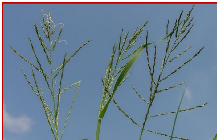
Detalle de las inflorescencias de Leptochloa spp. antes de madurar

La leptochloa es una mala hierba que, inicialmente, aparece en los márgenes de los campos de arroz y en zonas poco encharcadas , pero poco a poco puede ir colonizando el resto de la parcela. Su germinación escalonada, la gran capacidad de ahijamiento y la elevada producción de semillas, son los aspectos que favorecen la proliferación de esta especie. A esto hay que añadir que el control químico en arroz mediante herbicidas es ineficaz. Afortunadamente, esta especie es sensible al encharcado continuo, por lo que en parcelas en las que la lámina de agua es elevada y constante se mantiene solo en los márgenes o en zonas menos encharcadas.