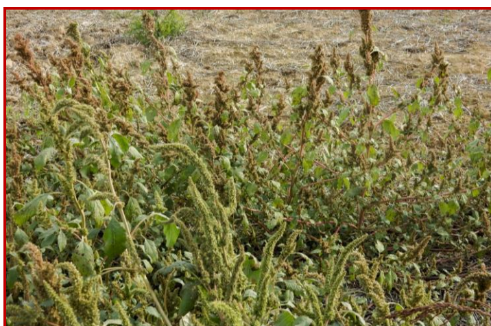
Plantas de A. palmeri en primer lugar con las inflorescencias de color verde claro y A. retroflexus en segundo lugar con las inflorescencias ya maduras de color pardo.

Para conocer mejor esta mala hierba pueden consultar esta publicación: Amaranthus palmeri