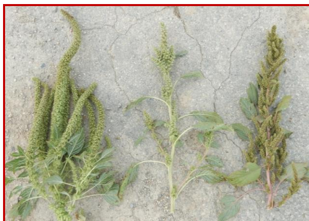
Inflorescencias de A. palmeri (izda.), A. hybridus (centro) y A. retroflexus (dcha.)