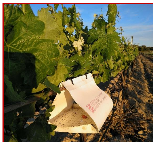
Trampa de polilla del racimo

Durante el mes de mayo ha finalizado el vuelo de la primera generación en todas las zonas vitícolas de la Comunidad Autónoma a excepción de la Zona de Calatayud, en la que a finales de mes se ha producido el pico de vuelo. Normalmente las larvas procedentes de esta generación no suelen causar daños de importancia en los racimos y al producirse escalonadamente la salida de los adultos es más complicado concretar el momento idóneo de tratamiento, por lo que no se recomienda realizar tratamientos para esta generación, salvo en parcelas problemáticas.