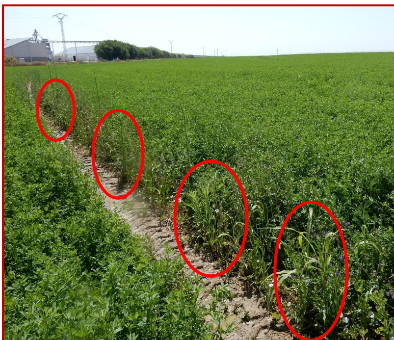
Plantas de teosinte a lo largo de toda la rodada del sistema de riego en pivot en parcela de alfalfa

Del mismo modo, hay que prestar especial atención a aquellas parcelas que en años anteriores fueron infestadas por teosinte y que en la actualidad están sembradas con otros cultivos alternativos al maíz (alfalfa, cereales, girasol, guisante, barbecho, etc.) ya que se han encontrado parcelas infestadas de teosinte que tenían la prohibición de poner maíz a pesar de que en otros cultivos es relativamente fácil el control de esta mala hierba. Esta situación obliga a continuar con la prohibición de implantar maíz aun cuando hubiera cumplido los tres años iniciales sin este cultivo. Además, se deben vigilar, a su vez, las zonas de aspersores, líneas de pisadas de pivots, etc., ya que aquí también es frecuente encontrar plantas de teosinte.