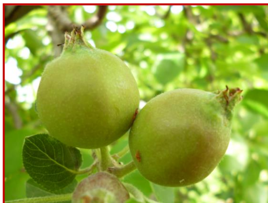
Daños recientes de carpocapsa en manzana

El control en aquellas parcelas con daños elevados en campañas anteriores, debe ser extremado, incluso reduciendo la frecuencia de las aplicaciones de tratamientos insecticidas en caso de ser necesario. En este tipo de parcelas es conveniente realizar controles periódicos de frutos, para ver los que presentan daños recientes, de manera que se puedan detectar los momentos críticos del ciclo biológico de la plaga.