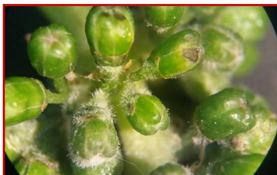
Daño de oídio en glomérulo

Los productos recomendados para su control en el Boletín Nº 2 (marzo-abril).