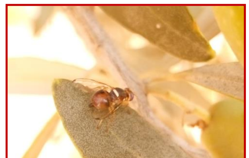
Hembra de mosca del olivo

En junio empieza la campaña de la mosca del olivo, las diferentes ATRIAS de olivar y personal del Centro de Sanidad y Certificación Vegetal llevan el seguimiento de las poblaciones en las diferentes comarcas olivareras de Aragón, la toma de datos se realiza con la aplicación informática RedFAra.