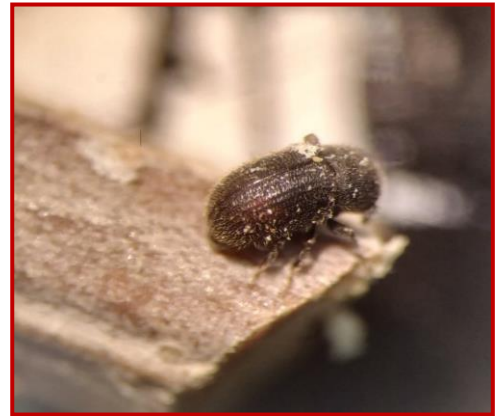
Adulto de Hylesinus

Por parte del Centro de Sanidad y Certificación Vegetal se realiza un seguimiento de su evolución larvaria para determinar el momento de su salida y recomendar las fechas más adecuadas para realizar tratamientos fitosanitarios. Se dará aviso mediante correo electrónico, donde se indicarán las fechas idóneas de tratamiento.