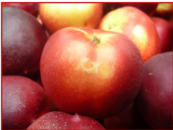
Daños de F. occidentalis en nectarina

A partir del comienzo de la maduración, las ninfas de esta plaga provocan el típico daño denominado "plateado de los frutos", al vaciar las células con sus picaduras. Los daños pueden observarse en nectarinas y algunos melocotones de piel roja, y aunque no es muy habitual, también en cereza, en variedades tardías y de fructificación apiñada.