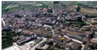
Municipio invitado: Grañén