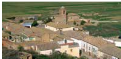
Municipio invitado: Huerto