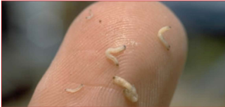
Larvas de Diabrotica virgifera

Ante la posible aparición de esta plaga en las parcelas de maíz, se recomienda realizar diferentes prácticas culturales como son: rotación de cultivo, picado de los restos del cultivo y plantas adventicias, adaptar la siembra de maíz para evitar la germinación del cultivo con la eclosión de las larvas (finales de primavera), así como extremar la limpieza de la maquinaria.