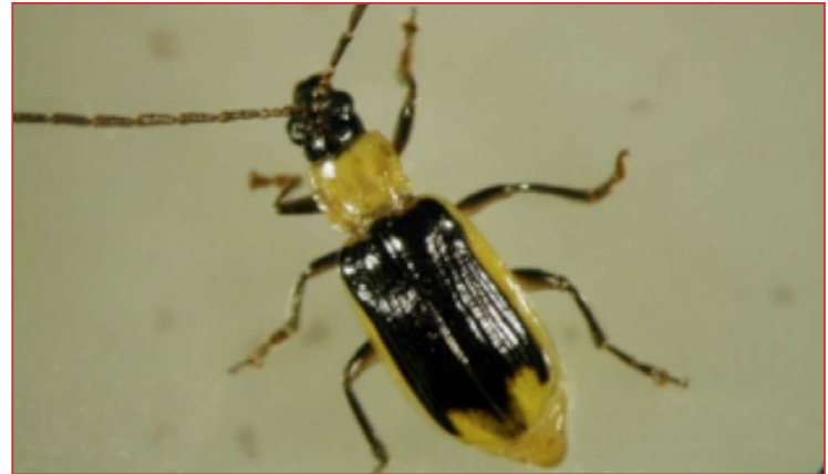
Adulto macho de Diabrotica