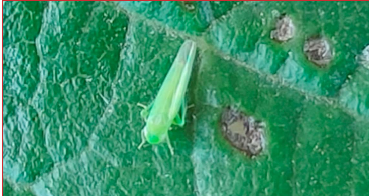
Mosquito verde sobre una hoja

Este cicadélido, que hizo su aparición a mediados del mes de junio, ha ido generalizando su presencia en todas las zonas de la comunidad, aunque por el momento en niveles inferiores a la campaña pasada debido a las condiciones climatológicas que se han producido hasta el momento. Conforme las temperaturas aumenten, es previsible que también lo haga la presión de esta plaga, por lo que se debe prestar especial atención a plantaciones jóvenes y viveros, ya que es donde