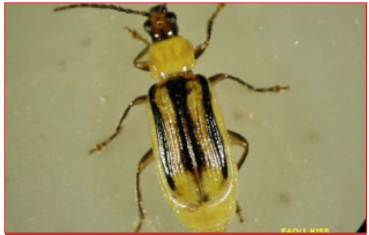
Adulto hembra de Diabrotica