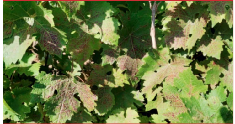
Síntomas de araña amarilla en hoja

La aparición y desarrollo de araña se ve propiciada por elevadas temperaturas. Los daños comienzan en las hojas basales ascendiendo a hojas superiores, se ven pequeñas manchas rojizas que se van extendiendo entre las nerviaciones de la hoja. En caso que se observen daños sobre el 60% de la superficie foliar, se deberá realizar un tratamiento con alguno de los productos indicados en el boletín n° 3.