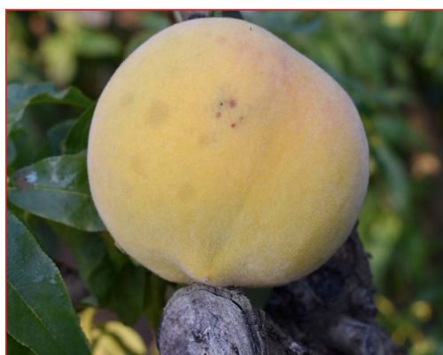
Daños de mosca de la fruta en melocotón

Las capturas de adultos de esta plaga, que se iniciaron en junio en las zonas más precoces, se han ido generalizando a lo largo del mes de julio, sin estar presentes todavía en las zonas más tardías como la comarca de Calatayud. Los niveles de la plaga en parcelas sin recolectar no son elevados y tampoco se han detectado todavía