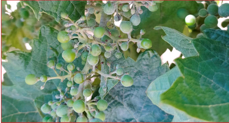
Daño de oidio en racimo

Para un buen aireamiento y una buena aplicación de los productos fitosanitarios, se recomienda el desnietado y el deshojado en zona de los racimos para eliminar el exceso de masa vegetal. Del mismo modo el pase por todas las filas mejorará la homogeneidad de las aplicaciones. Con estas medidas culturales permitiremos optimizar la aplicación.