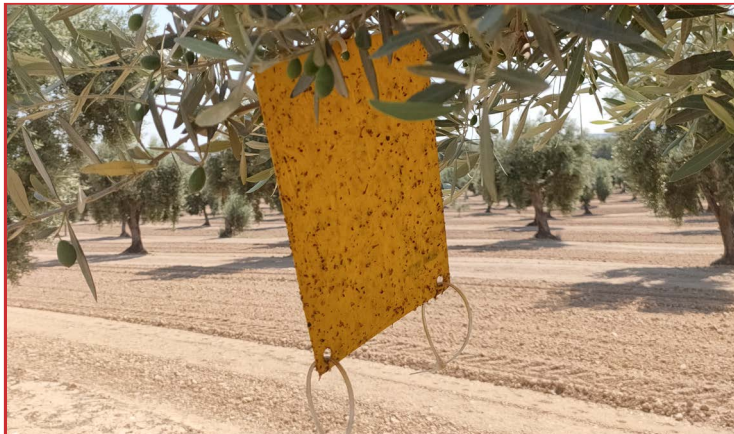
Placa amarilla para control mosca

Cuando se superen los umbrales de capturas de mosca por día y los de oliva picada, se emitirán los avisos correspondientes, para el tratamiento en las distintas zonas de olivar. Avisos que se realizarán a través de la web del Centro de Sanidad y Certificación Vegetal, así como por correo electrónico a los Ayuntamientos, Cooperativas y ATRIAS. Los productos recomendados para su control, aparecen en el Boletín Nº 4.