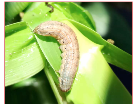
Larva de Mythimna unipuncta

Las larvas son de color pardo verdoso, con líneas dorsales blanquecinas, de unos 4 cm de longitud y es, en este estadio de desarrollo, cuando ocasionan los daños en la hoja de la planta. El adulto es una mariposa de una coloración marrón rojizo, con un pequeño punto blanco en el centro de las alas.