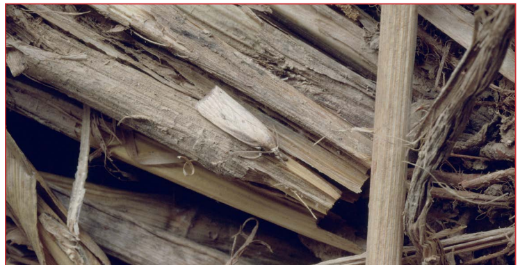
Adulto de Chilo suppressalis

Para conocer el potencial dañino de la plaga se debe realizar un seguimiento para determinar la curva de vuelo mediante trampas con feromonas de atracción sexual y en el caso de superar el umbral de tratamiento actuar sobre la plaga.