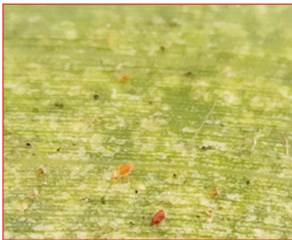
Tetranychus urticae en hoja de maíz

En los últimos años se están realizando ensayos de control de esta plaga mediante la suelta de depredadores con el fin de mantener la plaga en niveles por debajo de los umbrales económicos de daño.