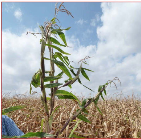
Fotografía 1. Inflorescencias de teosinte

Recordar que esta mala hierba sigue presente, mayormente, en los campos de maíz, pero también en girasol y algunas forrajeras. Su presencia va disminuyendo año tras año, pero hay que seguir con la vigilancia y el control.