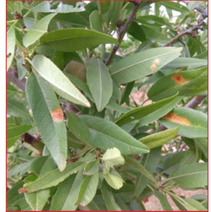
Daños de mancha ocre en almendro

De manera general, los daños producidos por esta enfermedad en la presente campaña han sido inferiores a los del año anterior al haber sido las condiciones climáticas menos favorables para su desarrollo. No obstante, la cantidad de afección es muy variable dependiendo principalmente de los tratamientos efectuados y del momento de aplicación de los mismos. A partir de este momento, no se recomienda realizar más tratamientos fitosanitarios contra mancha ocre.