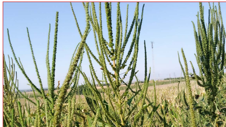
Aspecto de las inflorescencias de A. palmeri

Debe comunicarse al Centro de Sanidad y Certificación Vegetal la detección de cualquier parcela sospechosa de estar infectada por esta mala hierba.