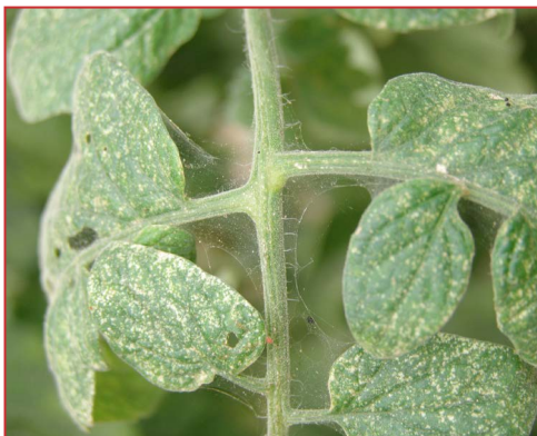
Daños de ácaros en tomate

Los daños de araña suelen iniciarse en el envés de las hojas y en la parte inferior de las plantas. Los daños de eriódidos se observan coloraciones marrones en el tallo y secado de las hojas.