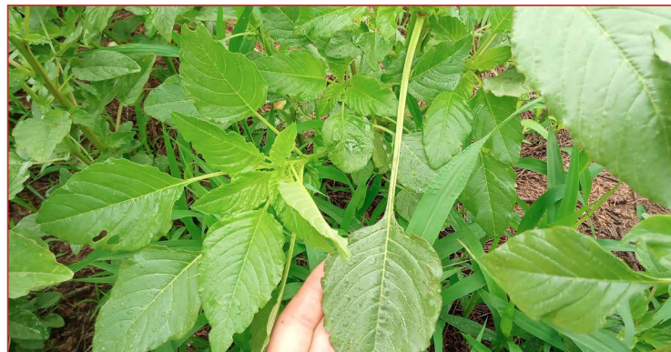
El peciolo de las hojas de A. palmeri es mucho más largo que el limbo de la hoja

En todo momento, puede consultar el Boletín y las Informaciones Fitosanitarias y en la página web del Gobierno de Aragón: aragon.es - sanidad y certificación vegetal.