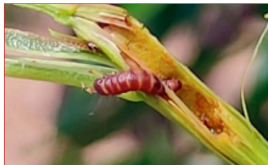
Larva de A. lineatella en brote

dos del mes de julio. Pese a todo lo anterior, es conveniente continuar vigilando las parcelas, sobre todo las 5 semanas anteriores a la recolección, y en caso de ser necesario realizar aplicaciones fitosanitarias, emplear los productos autorizados contra estas plagas que vienen citados en el Boletín N° 3.