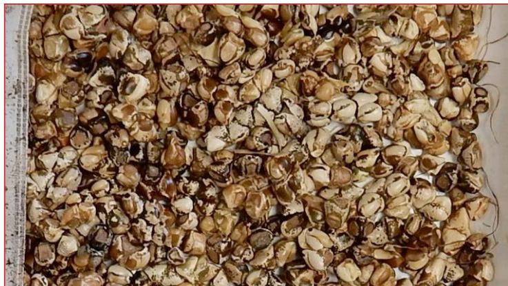
Fotografía 2. Semillas maduras de teosinte

Debe comunicarse al Centro de Sanidad y Certificación Vegetal la detección de cualquier parcela sospechosa de estar infectada por esta mala hierba.