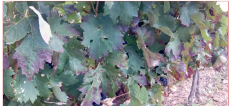
Síntomas de mosquito en hoja de vid

En esta campaña, no se están observando poblaciones importantes de este cicadélido. Los tratamientos solo son recomendables cuando se superan dos mosquitos por hoja, por lo tanto, a lo largo del mes de agosto se deberá vigilar las plantaciones de viñedo para comprobar su presencia, sobre todo aquellos viñedos con gran vigor y elevado desarrollo vegetativo. En caso que fuese necesario realizar un tratamiento para su control se debe mojar bien el envés de la hoja.