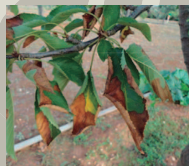
Quemado apical en cerezo, producido por X. fastidiosa