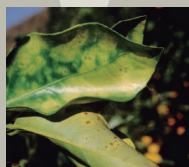
Moteado característico de la Clorosis variegada de los cítricos