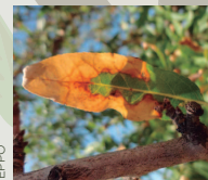
Quemado apical en almendro, producido por X. fastidiosa