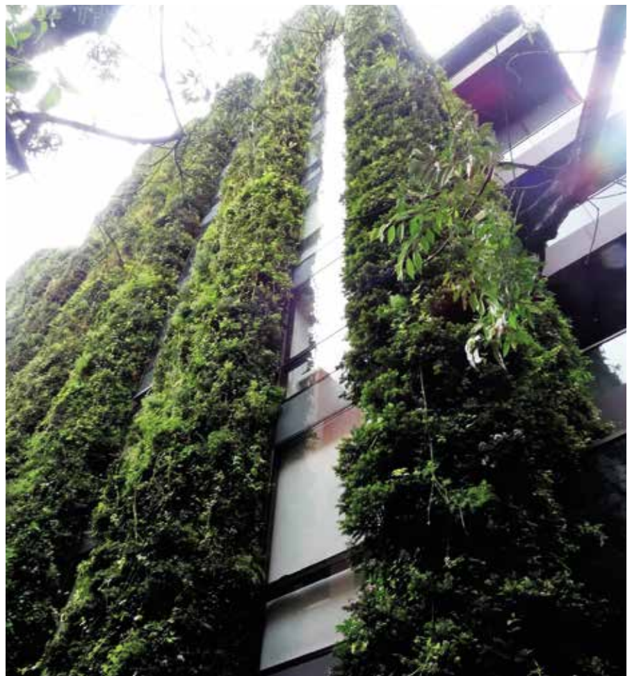
Edificio naturado Santalalía. Bogotá