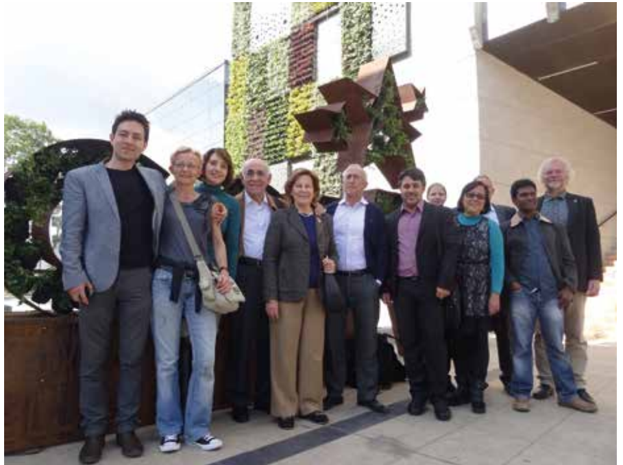
Entrada Congreso Ciudades Verdes en el mundo celebrado en Bogotá. 2016

Hay un proceso acelerado de movimientos migratorios del campo a la