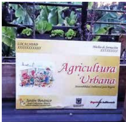
Agricultura urbana en el Botánico de Bogotá