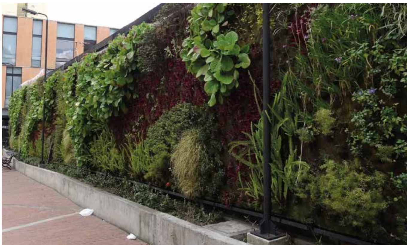
Pared verde. Bogotá

H ace pocos días, el pasado 9 de enero, nos dejó Zigmund Bauman reconocidísimo filósofo y sociólogo polaco, profesor universitario, autor de 57 libros, galardonado entre otras distinciones con el Premio Príncipe de Asturias 2010 de Comunicación y Humanidades y con el Premio Theodor W. Adorno de Alemania. Ha sido, quizás, el pensador que más