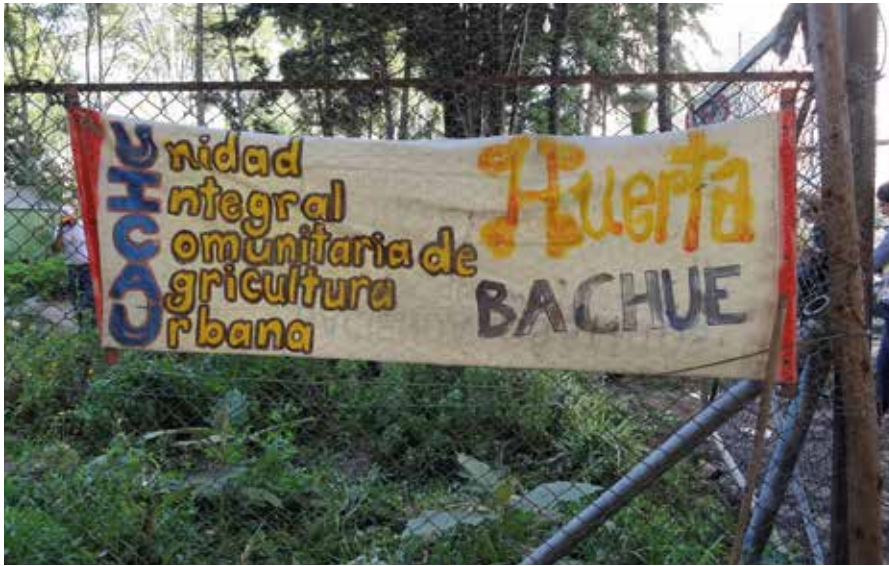
Huerta urbana Bachue. Bogotá