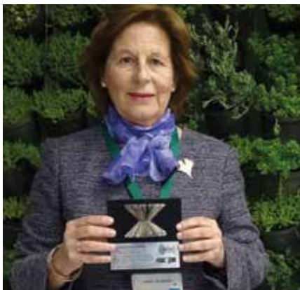
Premio al edificio itdUPM en el congreso de Ciudades Verdes de Bogotá