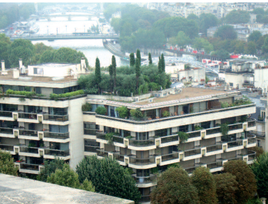
Terraza en Paris

Con la situación mencionada, WGIN y PRONATUR han considerado la oportunidad de publicar este libro con temas multidimensionales que se discuten en una amplia gama de escenarios. Bajo estas directrices, hemos organizado la publicación en varias áreas: economía, sociología y política; medioambiente, técnica