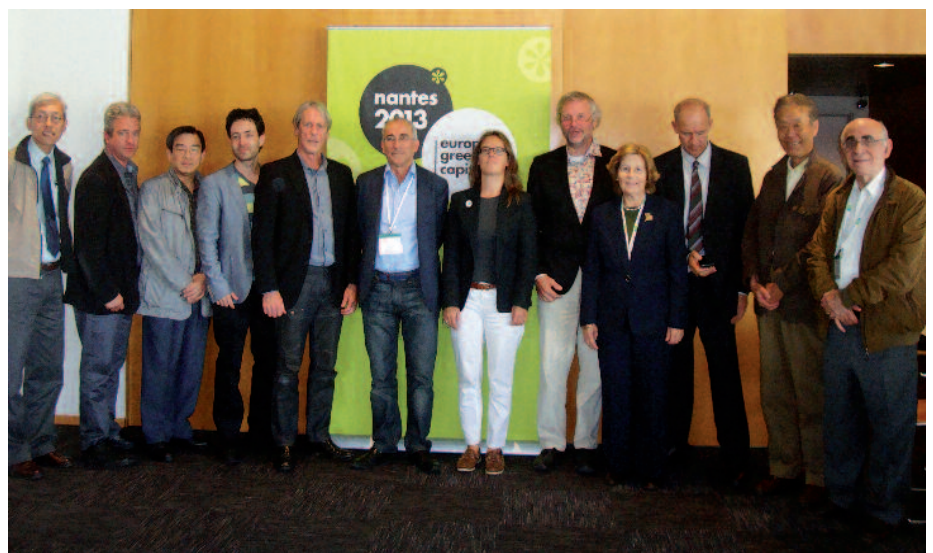
WGIN Congreso Nantes