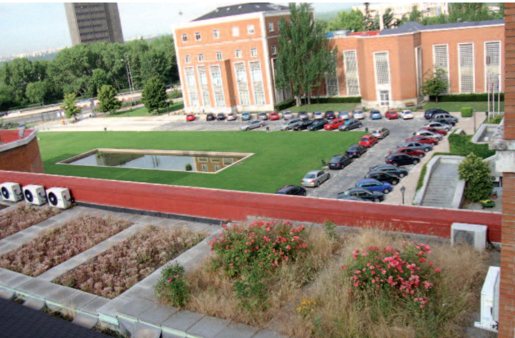
ETSI. Agrónomos. UPM. MADRID

este libro le permitirá encontrar nuevas ideas y la posibilidad de encontrar unas publicaciones complementarias.