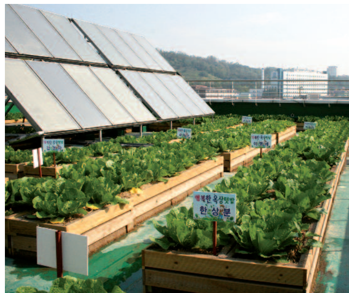
Huerto urbano en Korea

La naturación urbana (NU) incluye no solo el enverdecimiento sino la incorporación integral de la naturaleza en el entorno de la ciudad