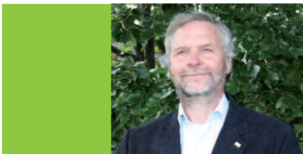
MANFRED KÖHLER Presidente World Green Infrastructure Network (WGIN: Red Mundial de Infraestructuras Verdes)

Se ha completado el proyecto del libro "Green cities in the world" fruto de la colaboración entre WGIN y la asociación española PRONATUR. Los editores hemos seleccionado las principales facetas de los aspectos de vegetación de las infraestructuras verdes urbanas (IVU) tema de gran actualidad internacional. Por ello, la publicación resultante, en pocas palabras, describe el papel de dichas infraestructuras en la evolución de las ciudades a nivel mundial. Somos conscientes de que hay otras ideas dignas de ser impresas, pero como este es el primer acto editorial de WGIN, nuestro primer objetivo ha sido la selección de una serie de autores, para explicar la amplia gama de oportunidades de las infraestructuras verdes.