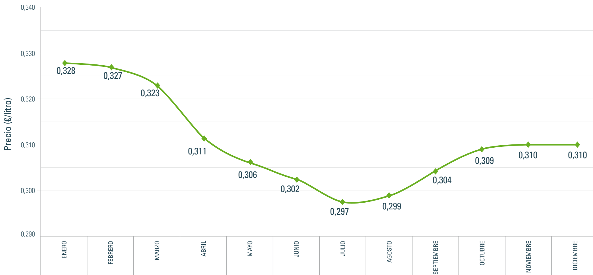
Evolución (Año 2015)