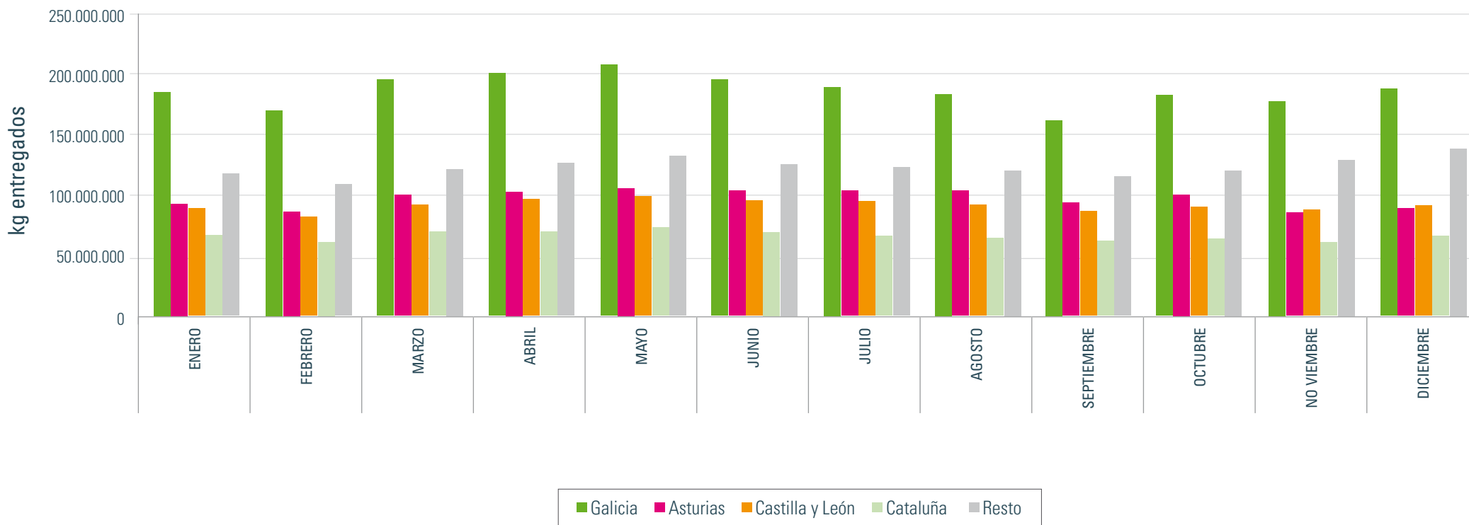
Entregas por CCAA comprador