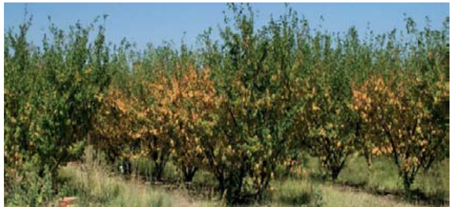
Foto 4. Árboles mostrando síntomas típicos del parasitismo del gusano cabezudo.

En conjunto, considerando que el 7% de la superficie de frutal de hueso está afectada con cierta intensidad por la plaga y que la pérdida de cosecha en estas plantaciones es del 25%, se pueden estimar unas pérdidas anuales de cosecha debidas directamente al gusano cabezudo de 20 millones de euros, a los que habría que añadir las derivadas de la muerte de árboles y necesidad de arranque anticipado de las plantaciones más afectadas, que podría suponer una cantidad anual similar.