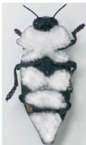
Foto 6 (derecha). Adulto de C. tenebrionis muerto por la acción de un hongo entomopatógeno.

programas contra plagas. Mediante el empleo de trampas biológicas (larvas del insecto Galleria mellonella ) se han obtenido aislados de hongos y nematodos entomopatógenos eficaces contra larvas de C. tenebrionis , aunque esos entomopatógenos no están actualmente en fase de producción industrial ( foto 6 ).