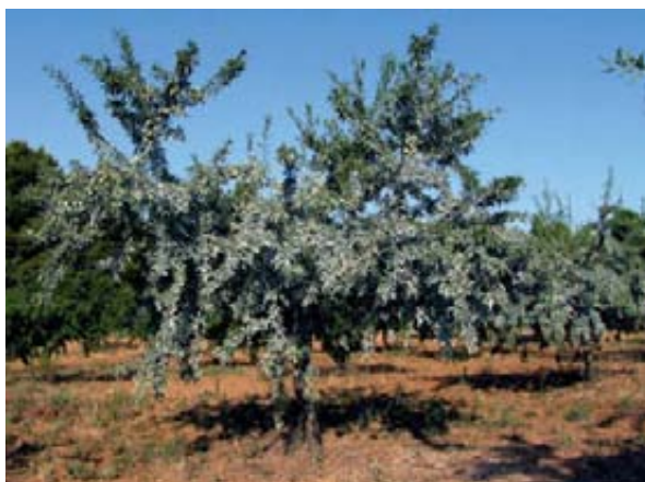
Foto 7. Árbol protegido frente al gusano cabezudo mediante formulados a base de caolín.

Las épocas recomendables de tratamientos, según los conocimientos actuales sobre