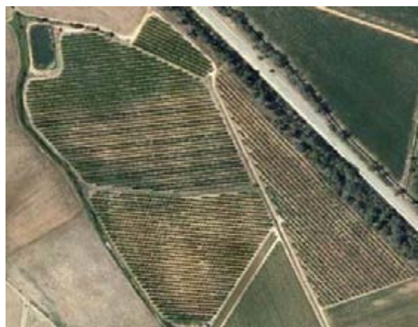
Foto 5 (izquierda). Vista aérea de una parcela de frutales parasitada por C. tenebrionis , en la cual la zona más afectada aparece con menor densidad de vegetación.