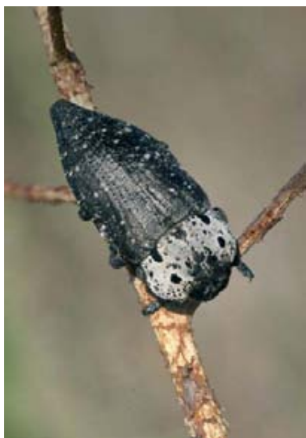
Foto 2 (izquierda). Adulto de C. tenebrionis sobre una rama en la que está alimentándose. Foto 3 (derecha). Larva de C. tenebrionis en el interior de una raíz.