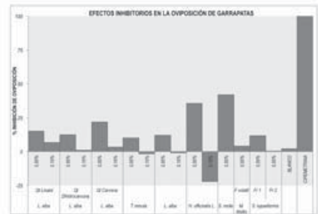
Figura 2. Índice de mortalidad (A) e inhibición de la oviposición de garrapatas (B) causadas por los aceites esenciales de Hisopo y Lippia alba (varios quimiotipos) al 0.5 y 0.1%.