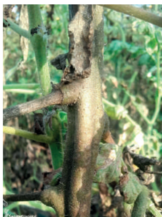
Vista general de un tallo dañado