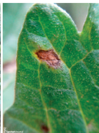
Detalle de lesión causada por bacterias