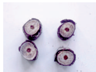
Enfermedad de Petri