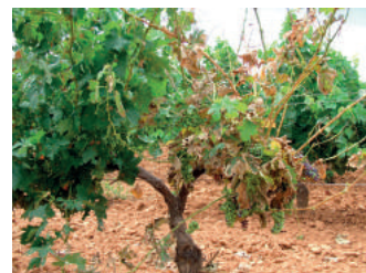
Yesca, forma lenta