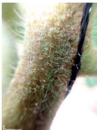
Detalle de daños en tallo

Este diminuto ácaro eriófito se localiza, inicialmente, en el envés de las hojas de la parte baja de la planta, pasando desapercibido hasta que se observan los daños al aumentar considerablemente sus poblaciones. Los ácaros son extremadamente pequeños en todos los estadios de su desarrollo y son difíciles de observar. Van ascendiendo por la planta a medida que van desecando la zona atacada, que va tomando una coloración marrón (bronceado de la piel), tanto en tallo, hojas y frutos. La diseminación se produce a través del viento o de la ropa del operario.