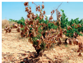
Yesca, forma rápida