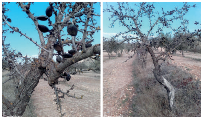
Vista general y detalle de almendras afectadas por Eurytoma amygdali

Muchas de las almendras afectadas por la avisvilla quedan en el árbol tras la recolección. De esas almendras, en la primavera del año que viene saldrán adultos que harán la puesta de huevos en las almendras recién cuajadas. Para evitarlo, una vez recogida la cosecha, es muy importante retirar (y destruir) las almendras afectadas por la avisvilla, ya que en caso contrario se favorece el desarrollo de la plaga.