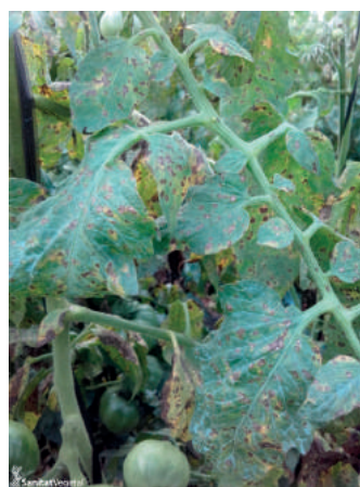
Vista general de hoja afectada por bacterias del género Xanthomonas

La presencia de hojas secas en la base de la planta, las continuas humedades y las temperaturas suaves del mes de septiembre provocan la aparición de pequeñas manchas negras o marrón oscuro en el haz de las hojas con un ligero halo amarillento que apenas evolucionan, típico de las bacteriosis. En el caso de los frutos, presentan las mismas picaduras negras contorneadas de un suave halo amarillento, que apenas crecen hasta formar pústulas de aspecto corchoso y tonos marrones oscuros.