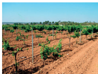
Decaimiento por Botryosphaeria