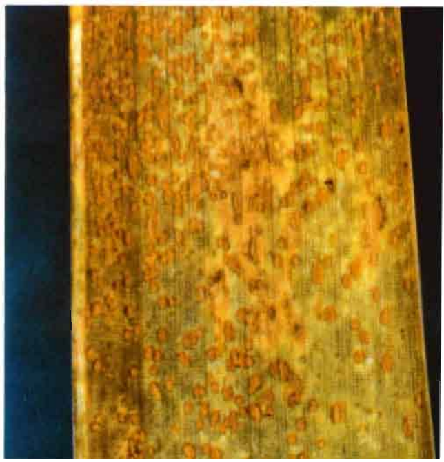
Fig. 4.—Hoja con pústulas de roya parda ( Puccinia recondita ).

La roya amarilla ha sido la más frecuente en los últimos años. Su aparición, intensidad y la duración de los ataques se ve propiciada por las circunstancias atmosféricas. Las de la primavera de 1978, en la que se alternaron muchas lluvias con temperaturas suaves, constituyeron el medio idóneo para esta enfermedad y por ello la intensidad del ataque alcanzó niveles desconocidos en los últimos años.