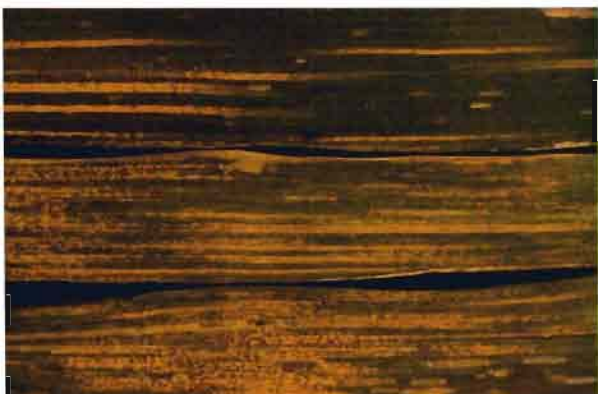
Fig. 5.—Hojas de trigo de la variedad Mahissa nº 1, afectadas por roya estriada.

Se mostraron muy sensibles las variedades Mahissa 1, Puma, Siete Cerros, Jupateco, Irnerio, y San Petronio. De sen-