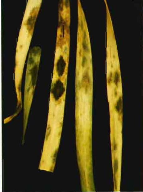
Fig. 2.—Primeros síntomas de Septoria Tritici en hojas bajas de trigo.

espigas es raro en nuestras latitudes, puesto que la temperatura a partir del espigado es lo suficientemente alta para dificultar el desarrollo del hongo.