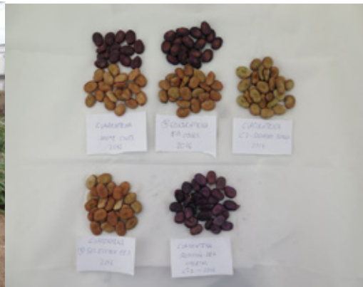
Fotografía 2. Semillas Cuarentena.