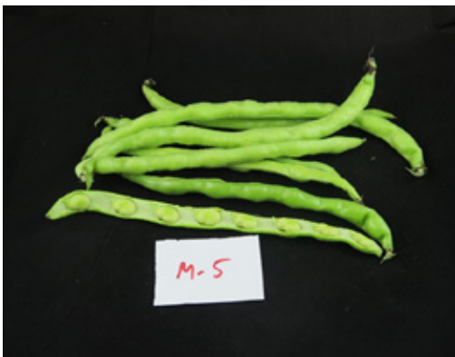
Fotografía 5. Cultivar C4, tipo "Cuarentena".