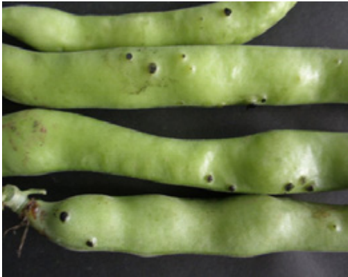
Fotografía 3. Roya ( Uromyces viciae-fabae ).