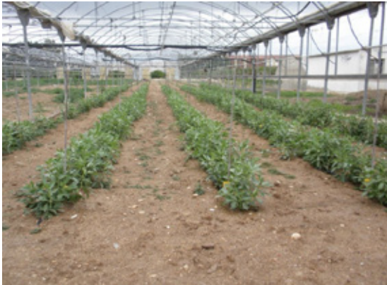
Fotografía 1. Vista del ensayo 2015-2016.