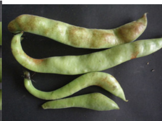
Fotografía 4. Destrió.