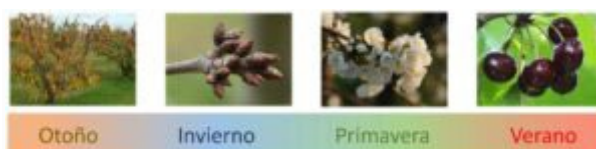
Figura 1. Esquema de la fenología del cerezo a lo largo de las estaciones.

Los frutales de clima templado incluyen los frutales de hueso (albaricoquero, almendro, cerezo, ciruelo y melocotonero) y los frutales de pepita (manzano, peral y membrillero). La superficie cultivada de frutales de clima templado en España es superior a 900.000 ha y se han producido cerca de 3 millones de toneladas de fruta. La producción se localiza principalmente en el valle del Ebro (La Rioja, Aragón y Cataluña), Extremadura y Murcia (MAPA, 2023).