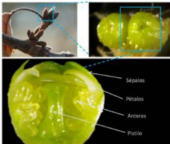
Figura 2. Desarrollo de las yemas florales de cerezo durante el invierno, en cuyo interior se pueden observar los primordios florales con las principales estructuras de la flor ya diferenciadas.

Los meristemos florales en el interior de la yema floral comienzan a diferenciarse en primavera o verano, cuando el fruto de la campaña anterior todavía está madurando en el árbol. El proceso de diferenciación floral continúa su desarrollo durante el otoño. En esta fase, en el interior de las yemas de la mayoría de especies se distinguen los primordios florales con todas las partes de la flor diferenciadas (sépalos, pétalos, estambres y pistilo) ( figura 2 ).