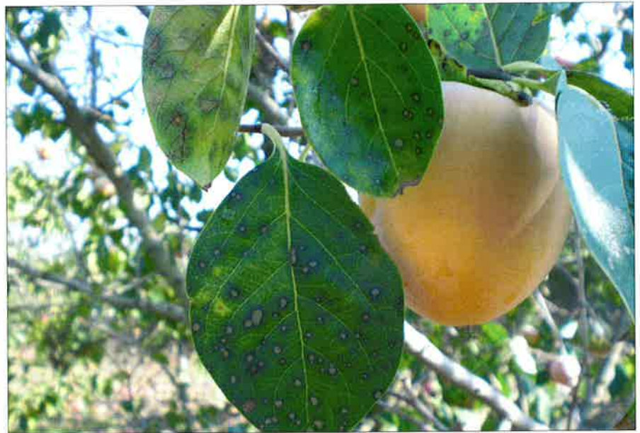
Síntomas de la mancha foliar causada por Mycosphaerella nawae en caqui cv. Rojo Brillante.