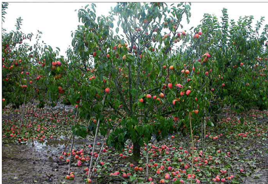
Maduración anticipada y caída de frutos en árboles afectados por Mycosphaerella nawaë .

hace algunos años, pero con la diferencia de que en esas zonas sí que hay productos fitosanitarios autorizados.