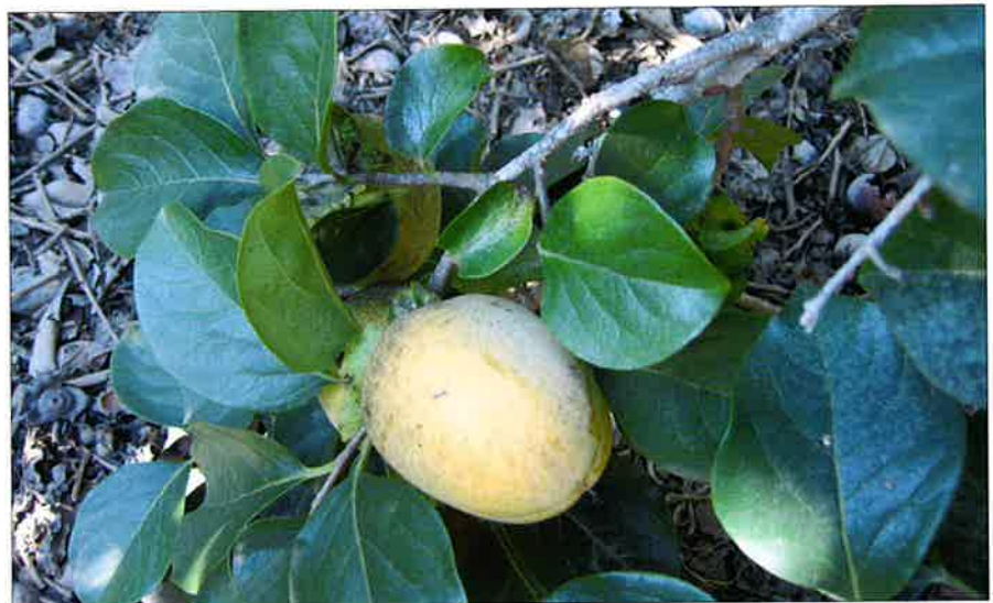
Presencia de negrilla por la acción de cotonet.

En cuanto a las plagas que afectan al cultivo del caqui, destaca en primer lugar, por volumen de da-