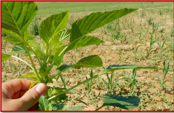
Detalle de planta de A. palmeri .

El peciolo es mucho más largo que el limbo de la hoja