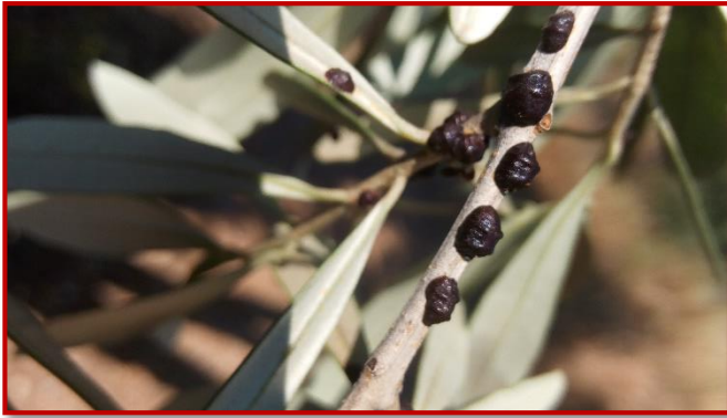
Cochinilla en rama

Si existe problema de cochinilla en alguna parcela. Sólo y únicamente en aquellos casos de gran infectación, se aconseja realizar un tratamiento cuando en los controles se observe el 100% de huevos eclosionados, que suele producirse a partir de la segunda quincena de agosto. Se utilizarán los productos recomendados en el Boletín Nº 3. No obstante, este tratamiento se podrá retrasar al mes de septiembre para tratar conjuntamente con la 2ª generación de mosca del olivo.