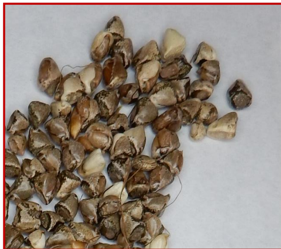
Semillas maduras de teosinte

Resulta difícil diferenciarlas del maíz cuando todavía no han ahijado. Lo más frecuente es que se encuentren fuera de las líneas del cultivo. No obstante, también puede haberlas en la línea, o cerca de ella, mostrando menor desarrollo que el cultivo. Se puede arrancar la planta con cuidado para que mantenga la raíz y ver si se encuentra alguna semilla, que en el caso del teosinte es de color marrón oscuro-negro.