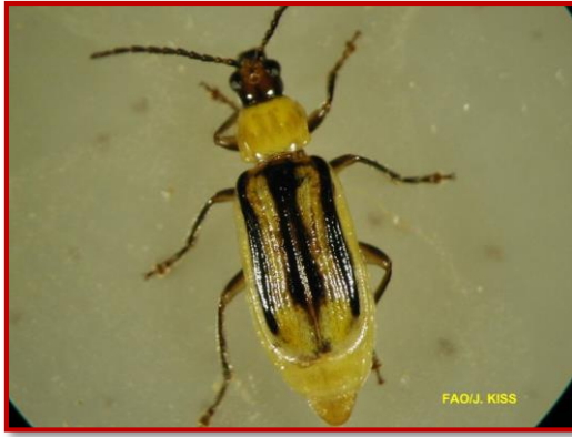
Adulto hembra de Diabrotica