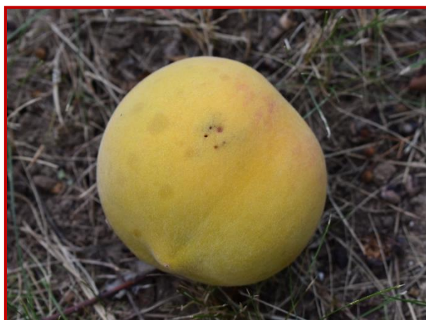
Daños de mosca de la fruta en melocotón

Al contrario que lo sucedido en la campaña de 2019, por el momento, las capturas de adultos de esta especie son muy bajas y únicamente se ha constatado la presencia de la misma en las comarcas de Bajo Aragón-Caspe y Bajo Cinca. No obstante, esta situación podría ir cambiando a lo largo del tiempo y es preciso seguir vigilando la evolución de la plaga, especialmente en el periodo que va desde el envero a la recolección. En caso de ser necesario realizar intervenciones fitosanitarias para su control, deben utilizarse las herramientas que se citan en el Boletín Nº 4, ya sean productos fitosanitarios o medios biotecnológicos. La eliminación total de frutos tras la recolección, es una medida eficaz para reducir la incidencia de la plaga en las parcelas vecinas.