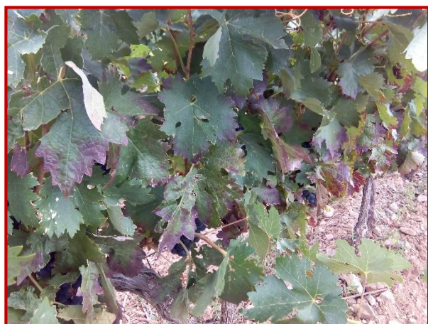
Síntomas de mosquito en hoja

Desde hace unas semanas se ha comenzado a observar este cicadélido. De pequeño tamaño y color verde, suelen estar en el envés de la hoja; para observarlos, podemos pasar la mano sobre las hojas y veremos cómo se desplazan en saltos hacia otras hojas. Tienen preferencia por los cultivos con gran desarrollo vegetativo y en esta campaña, que ha sido generalizado por las abundantes lluvias de primavera, debemos estar vigilantes.