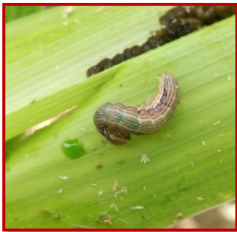
Larva de Mythimna unipuncta

Esta plaga se ha convertido en una de las más comunes en el cultivo del maíz en nuestra región, pero no solo puede llegar a afectar al cultivo del maíz, sino que también a otras