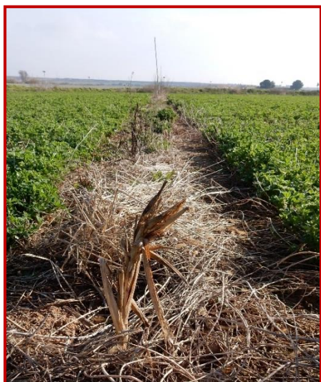
Detalle de una planta de teosinte en la línea de aspersores de un campo de alfalfa

También se encuentran plantas de teosinte cerca de aspersores e hidrantes, de las rodaduras de los pivots y en la entrada de la parcela por donde se empieza a cosechar.