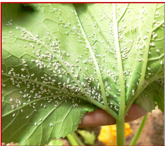
Mosca blanca en pepino

Las moscas blancas pueden atacar a un gran número de cultivos hortícolas (tomate, pepino, calabacín, crucíferas).