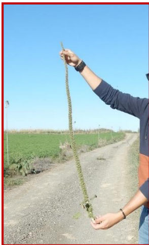
Aspecto de una inflorescencia de Amaranthus palmeri

En el caso de que los controles químicos mediante herbicidas hayan resultado menos eficientes de lo esperado, se recomienda eliminar las plantas de manera manual o segando en caso de encontrarse en lugares como bordes de caminos o líneas de aspersores, ya que esta especie genera muchísimas semillas. Se trata de una invasora que ha causado pérdidas millonarias en países como EEUU y donde los herbicidas han dejado de funcionar debido a la facilidad con la que esta planta selecciona la resistencia a más de 5 grupos herbicidas. Entre ellos encontramos la mesotriona y el glifosato, dos productos muy utilizados en nuestros campos.