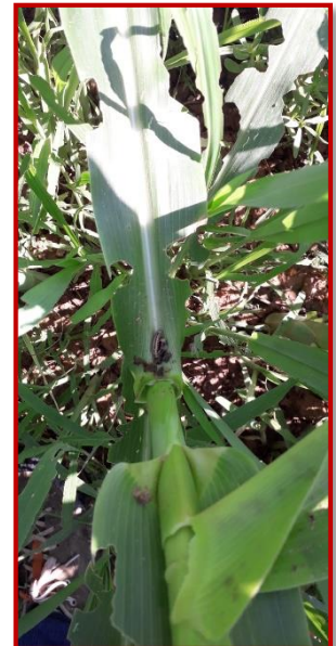
Daños de Mythimna unipuncta

Las larvas son de color pardo verdoso, con líneas dorsales blanquecinas, de unos 4 cm de longitud y son estas las que producen los daños en la hoja. El adulto es una mariposa de una coloración marrón rojizo, con un pequeño punto blanco en el centro de las alas.