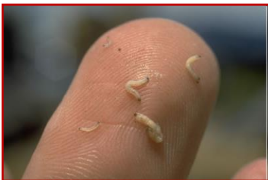
Larvas de Diabrotica virgifera

Hasta la actualidad no se ha detectado su presencia en España, pero está muy extendido en otros países de Europa. Los daños los causan principalmente las larvas al alimentarse de las raíces de las plantas, debilitándolas e incluso provocando la caída de éstas. Los adultos se pueden encontrar desde junio a septiembre en las hojas, panojas y sedas; antes, durante y después de la floración, respectivamente.