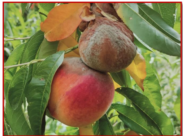
Daños de monilia en melocotonero

Los problemas de monilia en melocotoneros y nectarinas han sido hasta el momento generalizados, debido fundamentalmente a la presencia de frutos con el hueso abierto, y a los pedriscos y lluvias acaecidos en las semanas precedentes. Es previsible que la situación se mantenga en el futuro próximo o incluso se agrave a medida que las temperaturas desciendan y se incremente la humedad. Por tanto, será preciso realizar tratamientos con las sustancias que se relacionaban en el Boletín N° 3. Medidas como ajustar las aportaciones de nitrógeno y de agua, así como favorecer la aireación de los árboles, además de alternar productos de diferente modo de acción, son imprescindibles para lograr atenuar la incidencia de la enfermedad.