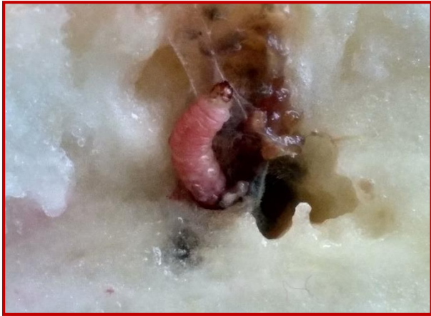
Larva de G. molesta en melocotón

El pico de vuelo de la tercera generación de polilla oriental se produjo a mediados del mes de julio, una semana antes que la campaña anterior. Actualmente las capturas de adultos son bajas en toda la comunidad excepto en las comarcas de Bajo Cinca, Calatayud y Valdejalón. El vuelo de la segunda generación de anarsia, se ha producido en las mismas fechas que el anterior lepidóptero citado. No obstante, las capturas son inferiores a las registradas el año anterior. Por el momento, los daños se mantienen bajos, aunque se debe continuar vigilando las parcelas, en especial las 5 semanas anteriores a la recolección. Los productos autorizados para la lucha química contra esta plaga vienen citados en el Boletín N° 3.