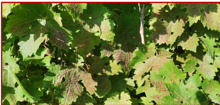
Síntomas de araña amarilla en hoja

En algunas zonas del campo de Borja se han detectado los primeros síntomas de su presencia. Empiezan en las hojas basales, dónde podemos observar pequeñas manchas de coloración rojiza que se van extendiendo entre las nerviaciones de la hoja y poco a poco van ascendiendo a hojas superiores. Se debe estar atento ya que las temperaturas previstas son altas y esto puede favorecer el desarrollo del ácaro. Si los síntomas afectan al 60% o más de la masa foliar se ha de realizar un tratamiento con alguno de los productos que figuran en el Boletín Nº 3