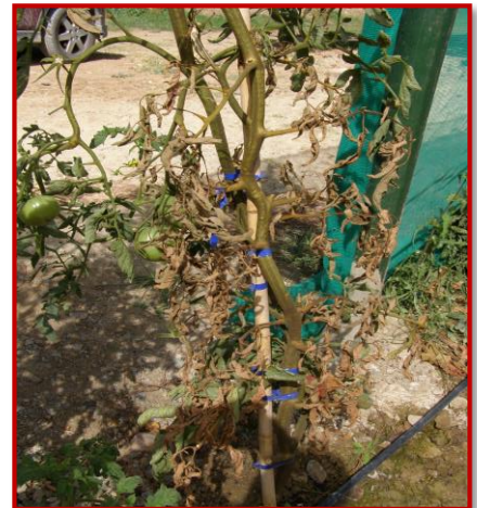
Daños de ácaros en tomate

En esta época del año, se prestará especial atención a los eriófidos, ya que en el cultivo del tomate pueden producir el secado de la plantación en pocos días.