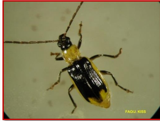
Adulto macho de Diabrotica

En el caso de detectar daños importantes de estas plagas en las parcelas se recomienda, al igual que con el resto de plagas, realizar diferentes prácticas culturales tras la cosecha, como son picados de los restos del cultivo, laboreo de las parcelas o rotación de cultivos para favorecer la descomposición de los restos.