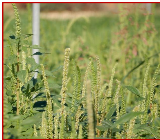
Aspecto de un grupo de plantas de esta misma especie con inflorescencias

Se recomienda que las máquinas cosechadoras sean revisadas antes de entrar a las parcelas ya que la semilla se dispersa muy fácilmente. Estas semillas son esféricas, muy pequeñas y de color negro brillante.