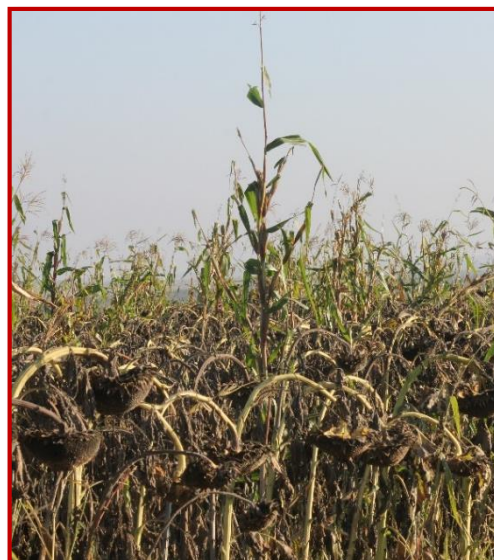
Elevada infestación de teosinte en una parcela de girasol

Puesto que en parcelas con obligación de rotación con otros cultivos como girasol o alfalfa se han encontrado plantas de teosinte, lo que hace que se aplique de nuevo la prohibición de siembra de maíz. Esto obliga a controlar las parcelas aun cuando no se cultive maíz.