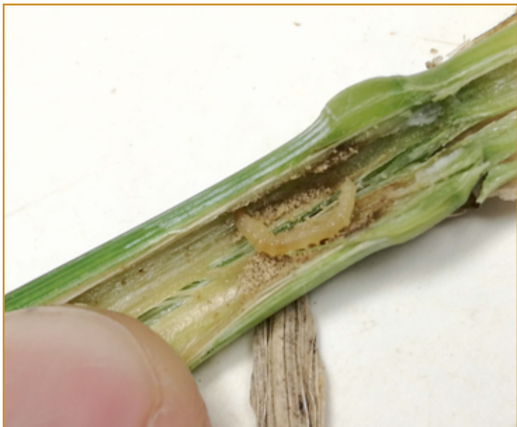
Larva de Calamobius filum