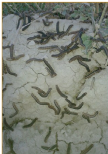
Larvas de Mythimna