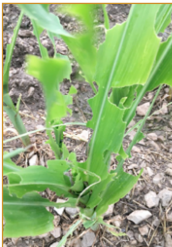
Daños de Mythimna