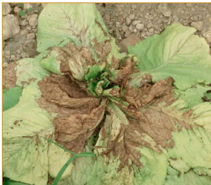
Virus del bronceado

En caso de duda, contactar con el Centro Sanidad y Certificación Vegetal para su diagnóstico.