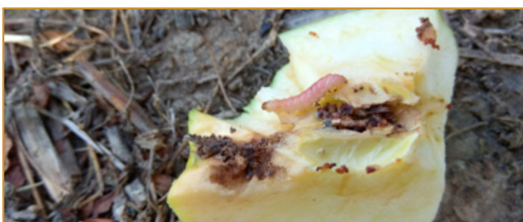
Daños de Carposapsa en manzana