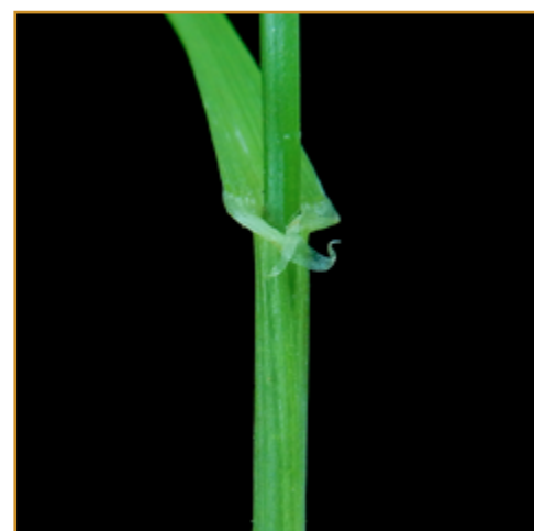
Diferentes estadios de vallico ( Lolium rigidum )