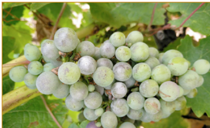
Daños de oidio en racimo