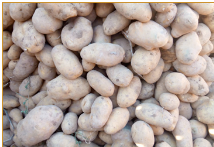
Patatas maduras y secas en recolección

Se recomienda utilizar para prevenir la brotación de los tuberculos uno de los siguientes productos, pudiéndose elegir aquel que contiene piretrinas que además controla la polilla de la patata en el almacén.