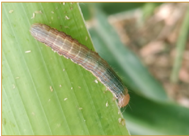
Larva de Mythimna

En caso de realizar tratamiento químico, consultar el Boletín Nº 4.