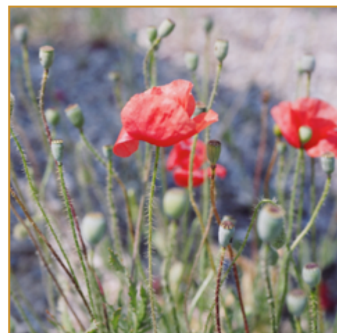
Diferentes estadios de la amapola ( Papaver rhoeas )