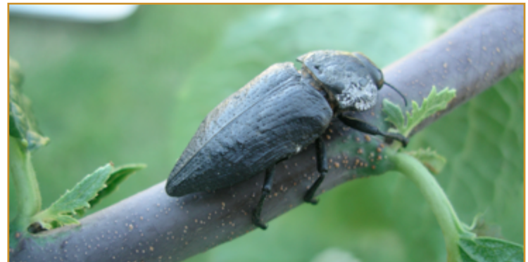
Adulto de gusano cabezudo

Este coleóptero causa daños principalmente en los cultivos de almendro, albaricoquero, cerezo y ciruelo. Además, si las plantaciones son de secano o de riego deficitario, los ataques suelen ser de mayor intensidad.