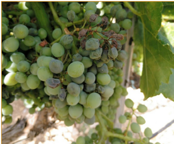
Daños de mildiu en racimo

En aquellas zonas y variedades que todavía no estén próximas a la recolección es importante seguir vigilando y si se observan daños, sobre todo presencia de polvo blanquecino en las bayas, mantener el cultivo protegido con fungicidas de acción curativa recomendados en el Boletín N° 2, mojando bien los racimos por ambas caras.