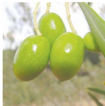
H Endurecimiento de hueso