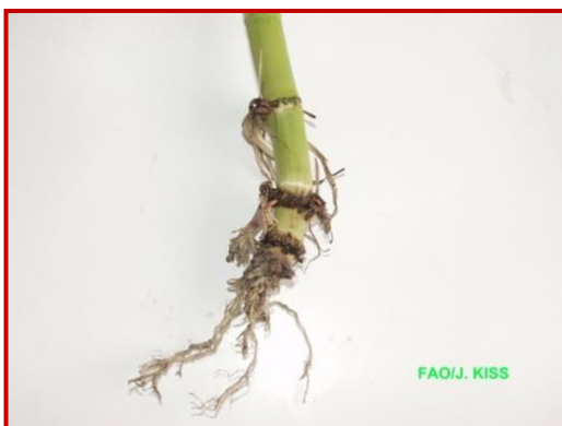
Daños en raíz por larvas de Diabrotica