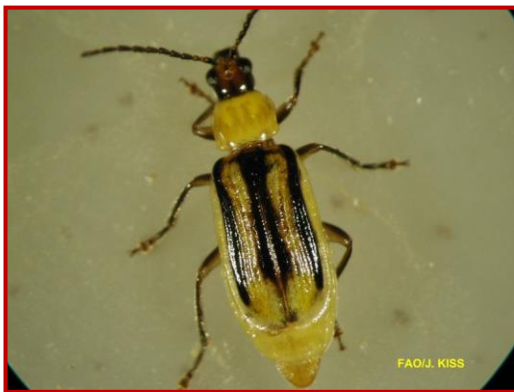
Adulto hembra de Diabrotica