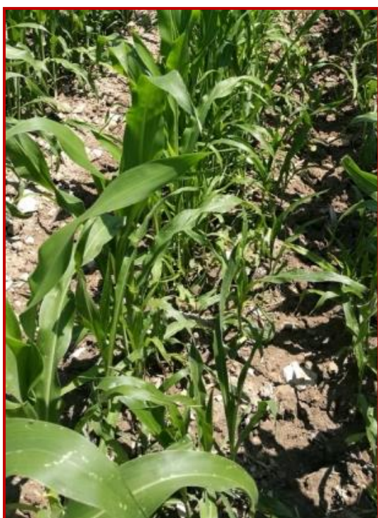
Parcela de maíz infestada de teosinte

Esta mala hierba ya conocida por los productores de maíz desde hace 5-6 años sigue estando presente en parcelas de Aragón.