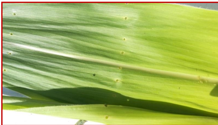
Daños en hoja de Ostrinia nubilalis