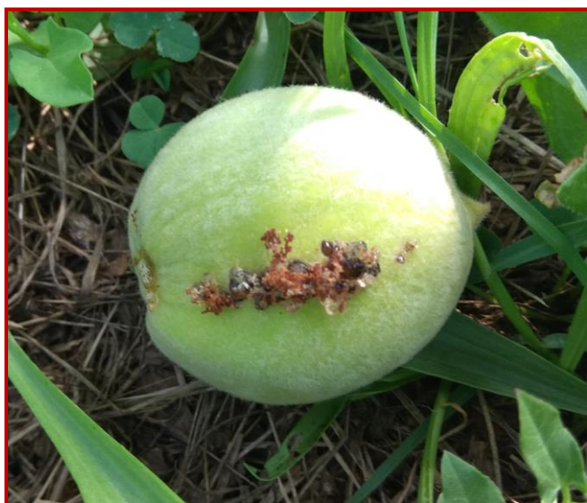
Daños de polilla oriental en fruto verde

Por el momento, la situación general de estas dos plagas durante la presente campaña es mucho más favorable que lo que venía sucediendo en los últimos años. En general, las capturas de adultos se mantienen bajas en comarcas como Cinca Medio, La Litera, Bajo Cinca, Calatayud, Caspe y Bajo Aragón.