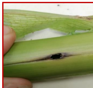
Orificio de entrada en tallo producido por Ostrinia nubilalis

Es de una de las principales plagas del maíz. Los adultos son mariposas de color amarillo a marrón claro, con el primer y segundo par de alas con líneas en zigzag oscuras. Los machos suelen ser un poco más oscuros y más pequeños que las hembras, de 20 a 25 mm de envergadura. Las larvas son de color marrón claro, gris o rosado, con la cabeza marrón oscuro o negra y una placa torácica clara, estas son las que causan los daños por perforación de las cañas y mazorcas. Los daños comienzan con pequeños mordiscos y perforaciones en las hojas de la planta, y posteriormente perforan el tallo comiéndose por dentro el pedúnculo que sostiene la flor masculina o penacho provocando su caída. En la siguiente generación ataca a la mazorca y tallos.