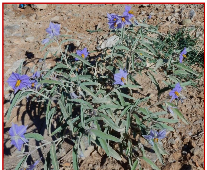
Planta de S. elaeagnifolium en flor

Una vez se labra el suelo y hay aporte de agua los focos se desarrollan rápidamente ya que, aparte de por semilla, el tomatito amarillo se reproduce por sistema radicular, de modo que el laboreo, sobre todo con rotovator, fragmenta y dispersa los rizomas a lo largo de la parcela. Las hojas de esta especie son más estrechas y alargadas que en el resto de especies del mismo género y tienen un color cenizo.