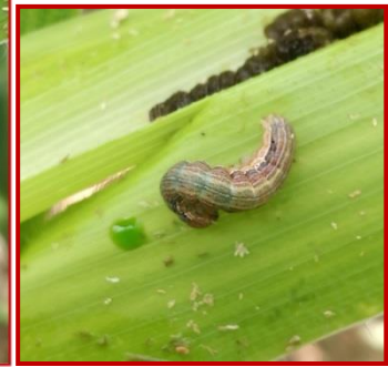
Larva de Mythimna unipuncta