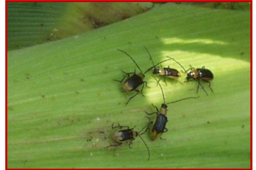
Adultos de Diabrotica virgifera