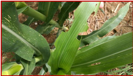
Daños de Mythimna unipuncta

En el verano de 2018 se detectaron parcelas cultivadas de festuca con grandes focos de esta plaga, es de suma importancia su detección precoz ya que puede llegar a causar graves daños en las cosechas.