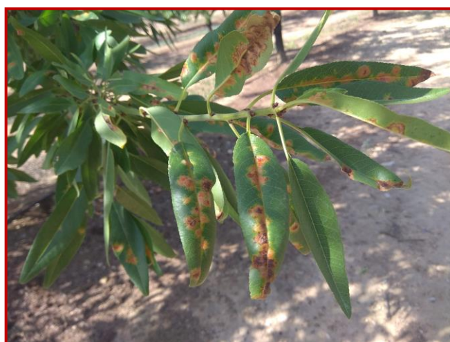
Síntomas de mancha ocre sobre brote de almendro

Las distintas variedades muestran una sensibilidad muy diferente frente a esta enfermedad. Durante el verano se hacen visibles los daños en las hojas infectadas en las semanas previas, presentando manchas de tonos amarillos, anaranjados y finalmente pardos. En el caso de infecciones severas, se pueden producir defoliaciones prematuras. A partir de esta época no se recomienda la realización de más tratamientos fitosanitarios.