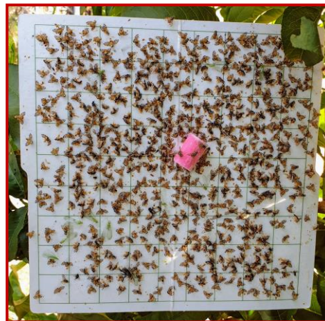
Trampa de C. capitata

Además de luchar contra la plaga mediante la aplicación de tratamientos fitosanitarios o la colocación de dispositivos de captura masiva o de atracción y muerte, pueden aplicarse algunas otras medidas para rebajar la población de este insecto. En este sentido, la técnica más efectiva consiste en la eliminación total de los frutos de las parcelas tras la recolección, que puede llevarse a cabo mediante la retirada total de frutos tanto del suelo como del árbol o su destrucción total en el suelo, tras el pase de herramientas segadoras-machacadoras.