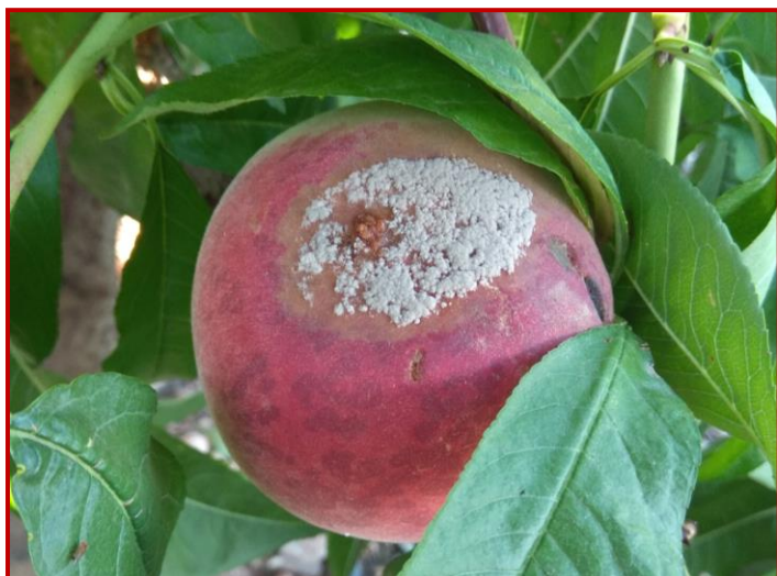
Daños de Monilinia spp. Sobre melocotón

Las temperaturas tan altas que se están produciendo, junto con la escasa humedad relativa, no favorecen el desarrollo de esta enfermedad. Sin embargo, las probables tormentas veraniegas y el previsible descenso de las temperaturas de la última parte del verano, pueden hacer que la situación cambie de manera radical. Los tratamientos contra esta enfermedad deben intensificarse en las semanas próximas a la recolección, momentos en los que se producen las infecciones sobre los frutos que comienzan con pequeñas manchas y evolucionan rápidamente a podredumbres. Además, es muy frecuente que las infecciones queden latentes y aparezcan durante el almacenamiento y la