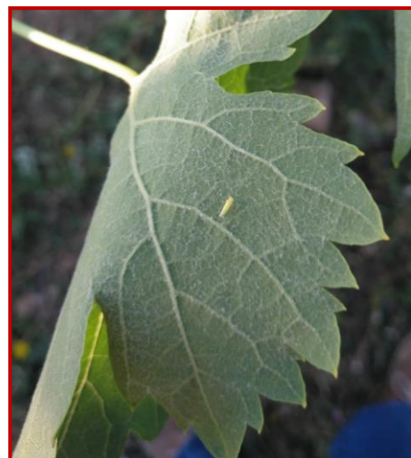
Mosquito en hoja de vid

Se recomienda vigilar las plantaciones con vegetación exuberante y, si se observan estos daños o la presencia de formas móviles en las cepas se debe de tratar sólo cuándo el nivel de plaga alcance los 2 insectos/hoja con alguno de los productos autorizados, realizando un mojado correcto del envés.