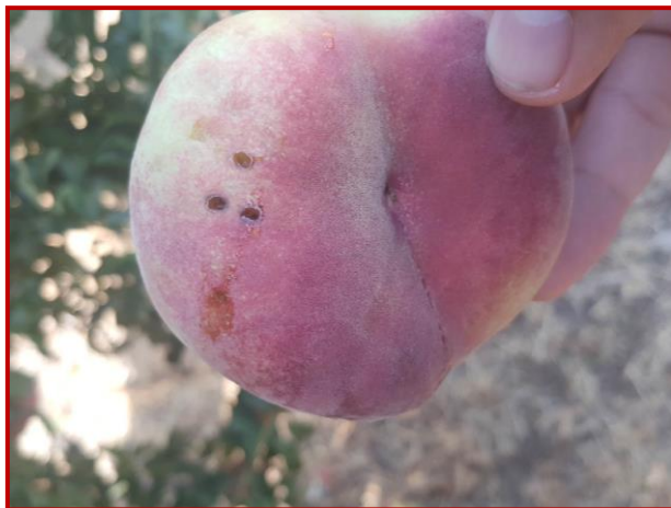
Paraguayo atacado por C. capitata