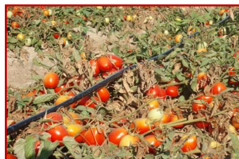
Daños de ácaros en tomate

El desarrollo de los eriófidos es muy rápido, se observan tallos de color marrón y un secado de las hojas.