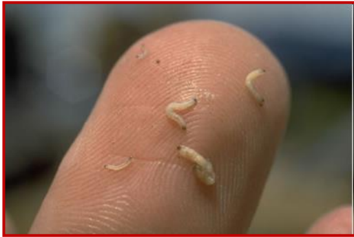
Larvas de Diabrotica virgifera

En caso de detectar su presencia o síntomas sospechosos deberán ponerse en contacto con el Centro de Sanidad y Certificación Vegetal.