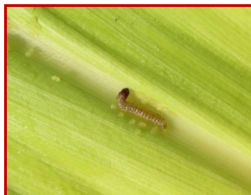
Larva de Ostrinia nubilalis