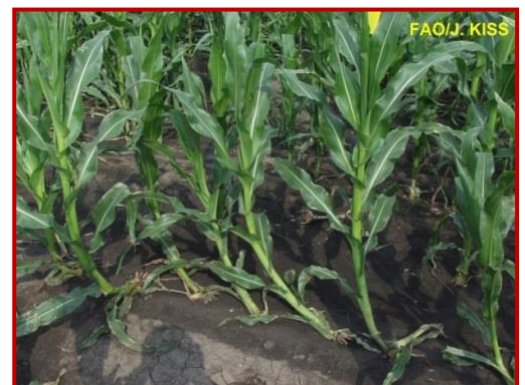
Daños provocados por Diabrotica

En el caso de detectar daños importantes de estas plagas en las parcelas se recomienda, al igual que con el resto de plagas, realizar diferentes prácticas culturales tras la cosecha, como son picados de los restos del cultivo, laboreo de las parcelas o rotación de cultivos para favorecer la descomposición de los restos.