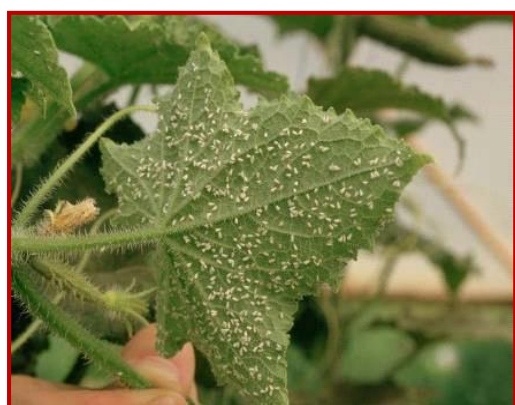
Mosca blanca en pepino

Las moscas blancas son insectos muy polívoros, que pueden atacar a un gran número de cultivos hortícolas (tomate, pepino, calabacín, crucíferas).