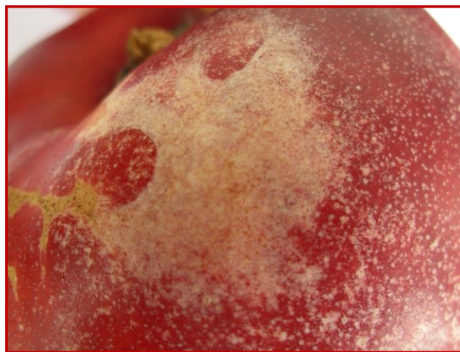
Daños de F. occidentalis sobre la epidermis de nectarina

Las poblaciones de esta especie de tisanóptero son mayores y aparecieron de manera notablemente anticipada frente a lo que ha sido habitual en los años precedentes. Llevar a cabo un manejo adecuado de la cubierta vegetal es fundamental para lograr que la plaga no cause daños importantes en el cultivo. Es sabido que la flora arvense suele ser el lugar donde inicialmente se hospeda esta plaga, por tanto, debe considerarse cuál es el momento y la forma más adecuada para la siega, evitando hacerlo en los momentos de mayor sensibilidad del cultivo, planteando la posibilidad de llevarla a cabo en calles alternas o acompasándola con los tratamientos químicos. El número de sustancias activas autorizadas y realmente eficaces para el control de esta plaga es ciertamente muy escaso. Sin embargo, esto no debe justificar en ningún caso el sobrepasar el número máximo de aplicaciones autorizadas por campaña, puesto que podría dar lugar a la aparición de resistencias.