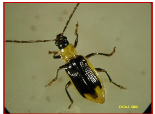
Adulto macho de Diabrotica