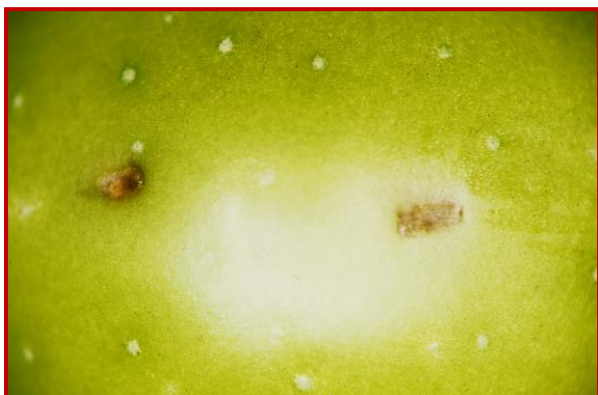
Detalle de aceituna picada por mosca

Ya está establecida la Red de vigilancia para el seguimiento de la mosca del olivo. Serán un total de 62 estaciones de control repartidas por todas las zonas olivareras de Aragón.