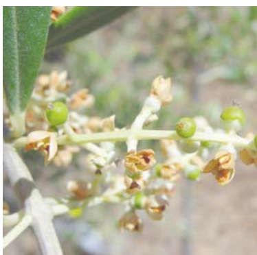
G Fruto cuajado

La totalidad de las comarcas están en fruto cuajado G , los frutos están ganando tamaño hasta que se produzca el endurecimiento de hueso aproximadamente en la tercera semana de julio